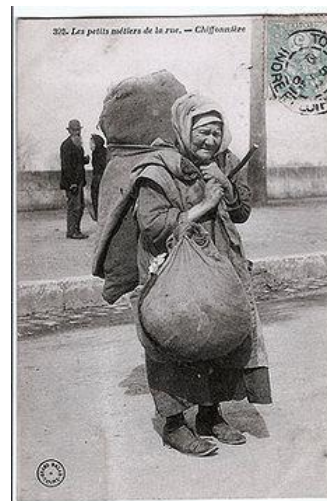
Chiffonnière (carte postale).

A la fin de l'histoire, l'héroïne est amenée à filer, puis tisser et enfin à coudre son propre vêtement, à nul autre pareil.