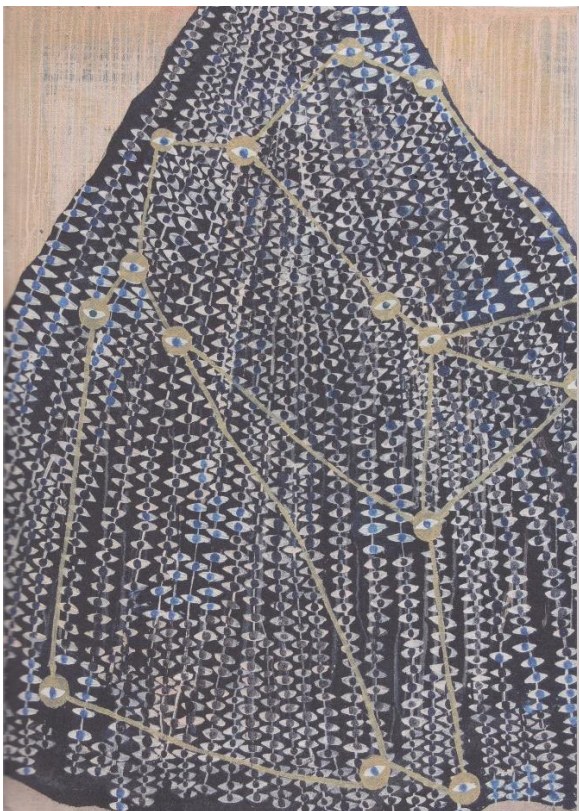
« Robe-yeux », de Alexandra Duprez,

Un conte italien joyeux et profond sur les apparences et le besoin d'être aimé et accepté pour soi-même.